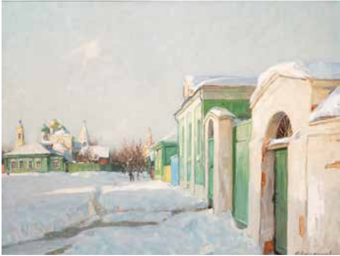
Январь. Начало дня. 2019

мотивация в искусстве, целеустремленность и работоспособность, и, безусловно, ответственность за свое дарование. Эти качества на протяжении всей жизни помогли ему продвигаться в профессиональном развитии.