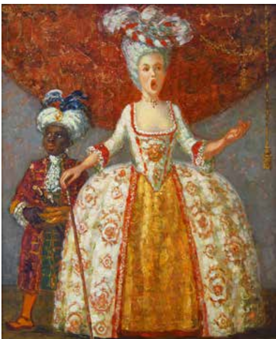
В. Ермолаев. Эскиз к к/ф "Концерт Барокко". 2018