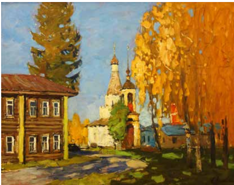
Осень в Переславле - Залесском. 2018

случаев человеческого сознание стремится ко времени круглых дат подвести итоги, маркируя важные вехи. По словам самого художника, это был момент, когда он захотел определиться с дальнейшими жизненными приоритетами. Будучи в раздумьях во время одного из посещений Третьяковской галереи, он внезапно поймал себя на мысли, что раньше не обращал внимания на возраст художников, в котором они создавали свои великие полотна. Внимательное изучение этого аспекта произвело в сознании Юрия Орлова перелом: значительное число шедевров было создано мастерами до их сорокалетия. Немедленно перед художником встал вопрос, а чего же он смог добиться как живописец и как личность к дате своего юбилея? Ответ не заставил себя ждать, и жизнь сама преподнесла художнику дары вдохновения: церковный обряд Крещения сына произвел на художника неизгладимое впечатление. Орлов вспоминает, как в течение всего