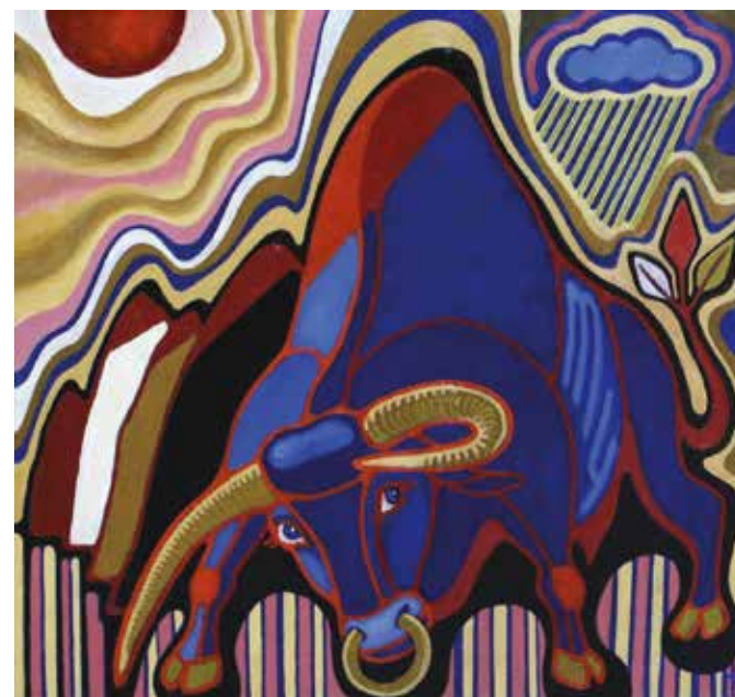
Н. Баранова. Бык

Александр Скворцов выставил большие листовые рисунки. Также были выставлены и произведения, созданные