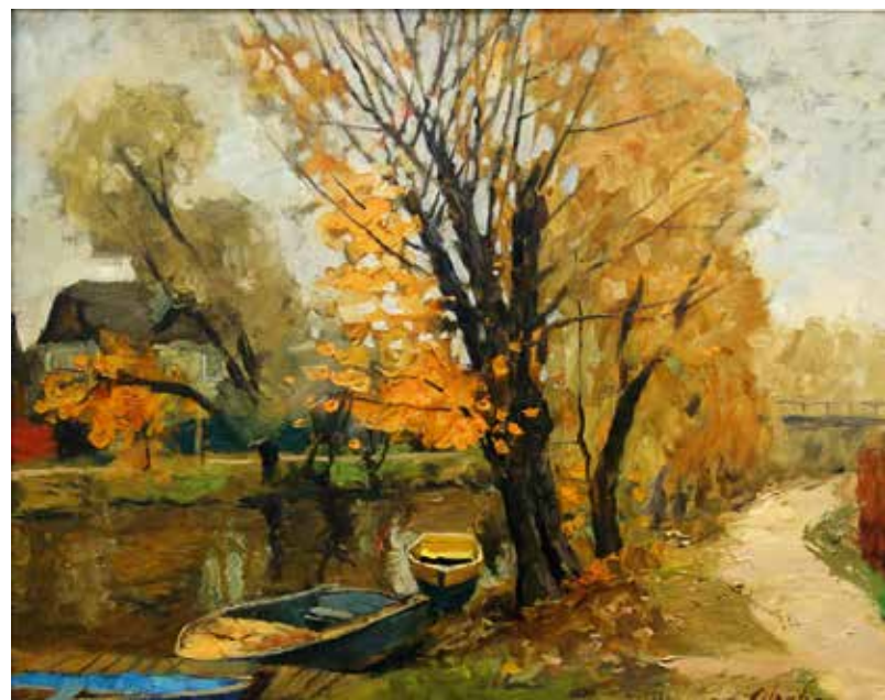
Тихий день. 2018