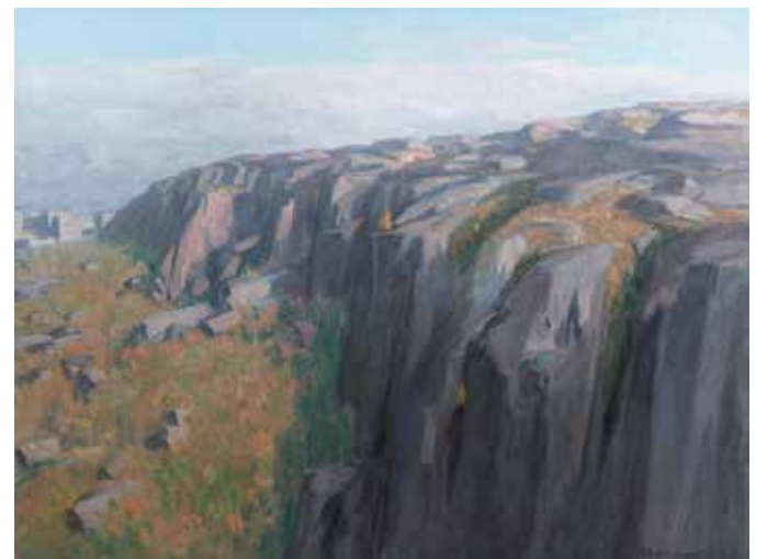
Скалы Мурманска. 2019