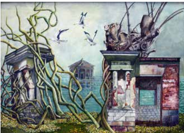
С. Ставцева. Урал. Осень. Темпера. 2018