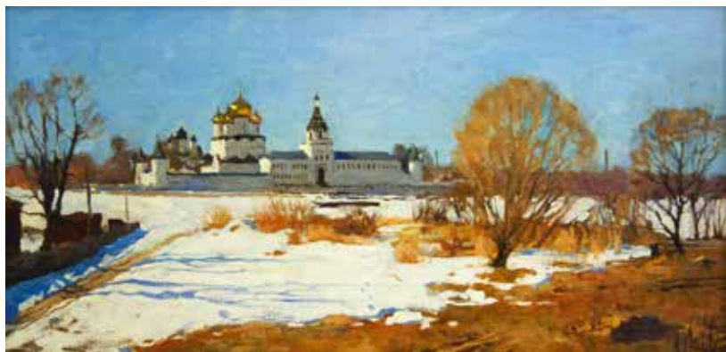
Ипатьевский монастырь. 2016