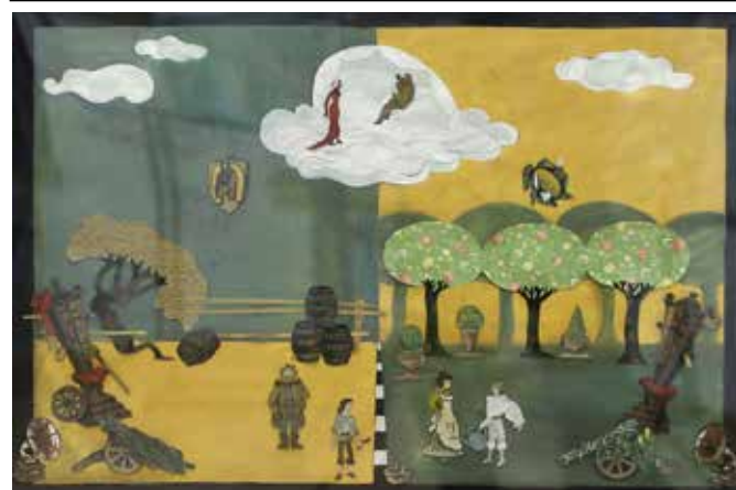
М. Арсеньева. Эскиз к спектаклю "Последний каприз феи Абажурь"