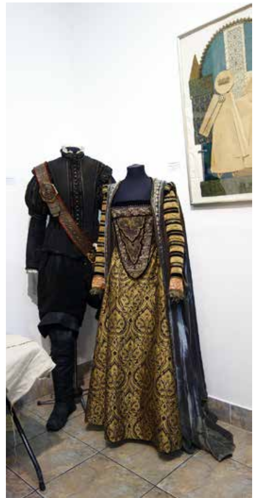
Н. Дзюбенко. Костюмы к к/ф "1612: хроники Смутного времени". Парча, шитье, бисер. 2007

- Самое главное - игровое пространственное мышление. Это далеко не каждому дано. Кто-то работает только на плоскости. Ощущать себя в развитии, во времени и пространстве сцены - вот, мне кажется, главная особенность. Плюс очень серьезные размышления над жизнью, над ее проблемами, над ритмом жизни, ощущениями. И обладание определенной культурой - все-таки приходится читать очень много, слушать музыку, интересоваться архитектурой, скульптурой, живописью. Но прежде всего, я считаю, у театрального художника должен быть очень подвижный