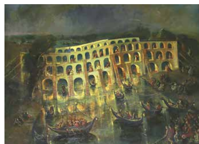
М. Уварова. Музыка на воде

Межсекционная выставка (живопись, графика, стекло, театр) « Силуэты Европы » на темы, вдохновленные европейской культурой, прошла в залах МСХ на Кузнецком мосту, 20 с 1 по 6 октября 2019 г.