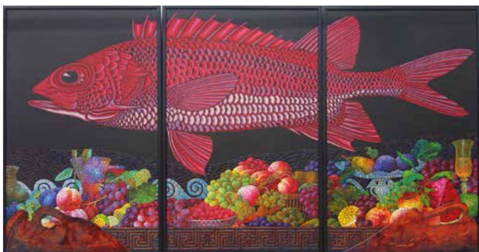
И. Четвертков. Триптих. Шельф. Большая красная рыба. 2019

3 ноября — вечер художественного факультета РАТИ (ГИТИС).