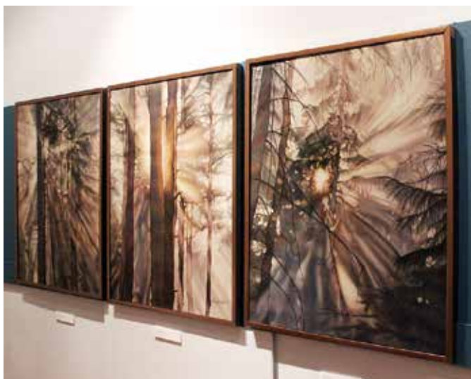
Серия "Лес и лучи солнца". 1980-1990 гг.