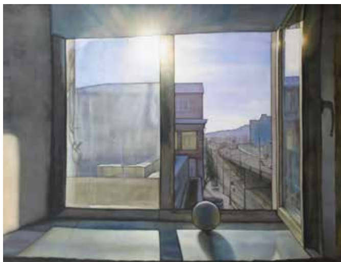
Серия "Моя Москва. Московские окна". 2014-2019