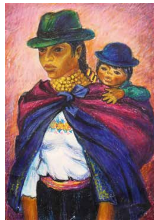
Из племени Кечуа