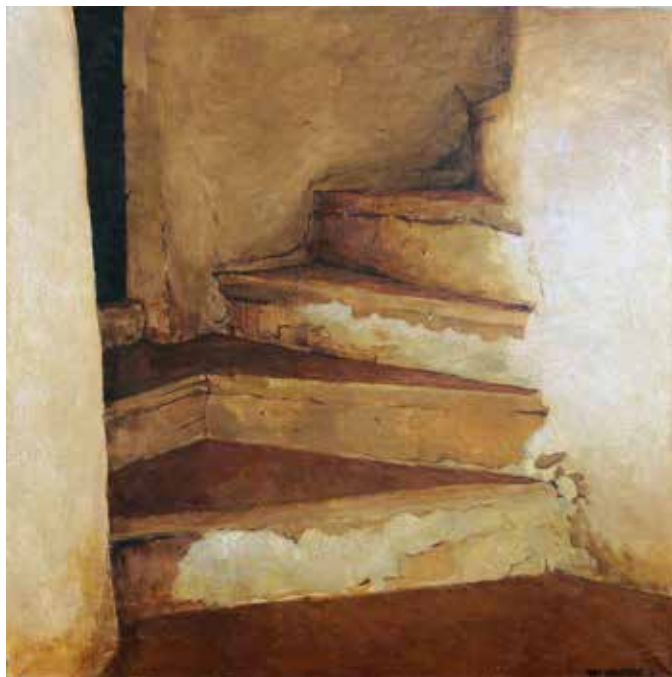
Лестница № 2. 2012