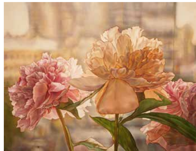
Серия "Пионы". 2003-2019