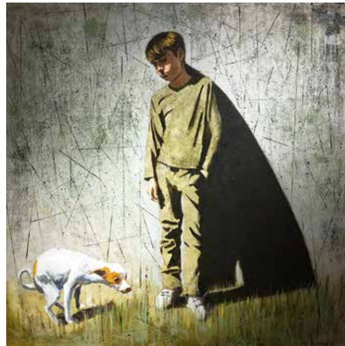
С другом. 2019

Мерцание света и тени создает гипнотическое