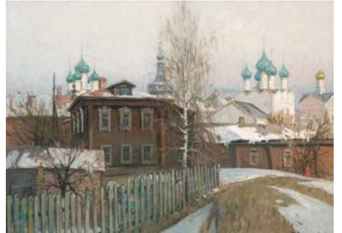
Начало апреля. 2018