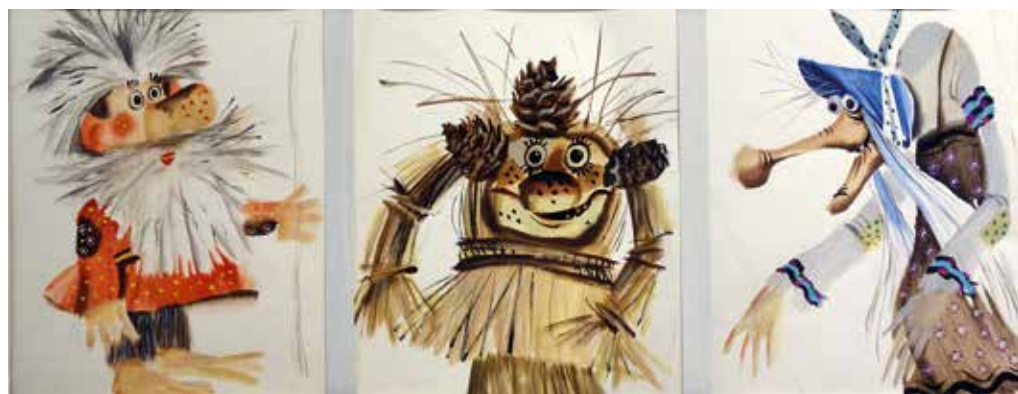
С. Феофанов. Эскизы кукол для телепередач режиссера Т. Паршиной. 1980

– Вообще-то, что постановщики, что декораторы, что художники по костюмам, мы всегда работаем, прежде всего, с образом. Актер несет образ, о котором написано в сценарии. И чем точнее сделан костюм этого образа, тем ему, актеру, интереснее, легче, проще и