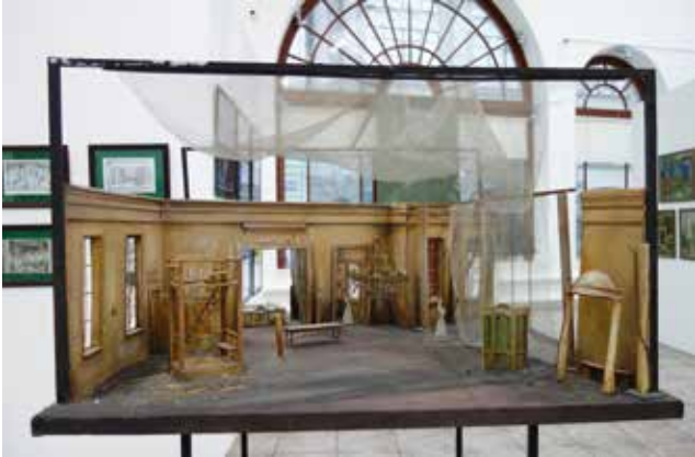
С. Бенедиктов. Макет к спектаклю И. Тургенева "Отцы и дети"