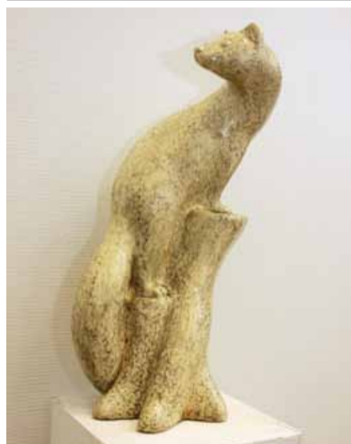
Г. Растакян. "Куница". Шамот. 2011

пторы стремятся обрести духовную опору в многовековых традициях религиозного сознания. Поиски эти далеко не просты. Особенно радует, что они носят осознанно-творческий подход и обещают в скором времени зрелые плоды. Разная стилистика и характер отличает произведения В. Потлова «Пророк» (металл) и предельно обобщенную скульптуру И. Балашова «Троица» (дерево), обладающую почти знаковым, символиче-