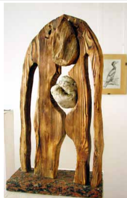
Н. Наумова. "Атлетика ума". Дерево, камень. 2011

В завершение хочется поздравить организаторов выставки с несомненной твор-