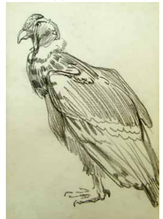
О. Яновский. Рисунок. Б., кар.

В затянувшийся на несколько десятилетий период общественного смятения и неизвестности в будущем — московские скульп-