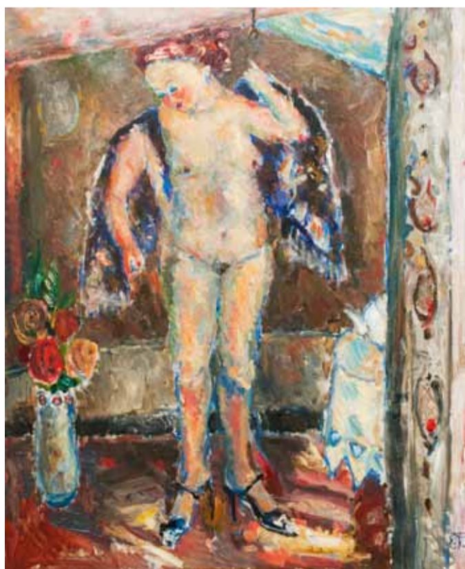
"Обнаженная с синим полотенцем". 2007