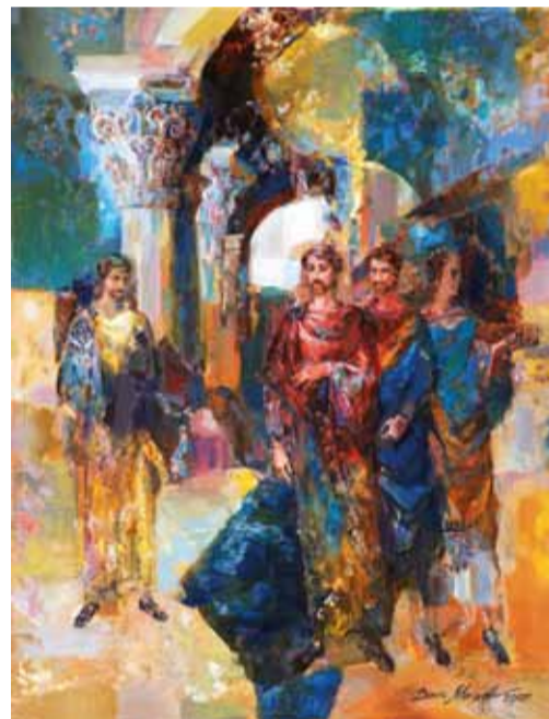
Д. Мацевский. "Дух царствует". 2007

С 2 по 16 марта с.г. в выставочном зале галереи искусств «Винсент», что в Кривоколенном переулке, с большим успехом прошла выставка двух известных московских художников Евгения и Дениса Мацевских. Деятельность галереи направлена на возрождение культурных ценностей, популяризацию русского искусства,