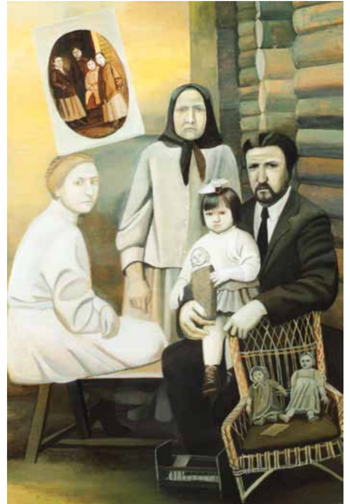
"Лето в деревне". 2010

Почти монохромные, казалось бы, буквально воспроизводящие цвет старых черно-белых фотографий, полотна Назаренко играют сложными оттенками коричневого и серо-черного цвета, градациями теплых и холодных тонов; вибрируют тонкими прикосновениями кисти, свет-