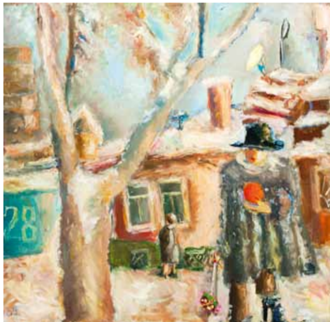
"2003-й год". 2003

С 4 по 16 апреля 2011 г. в Галерее на 1-й Тверской-Ямской, д. 20 была открыта экспозиция работ известного московского живописца Екатерины Григорьевой (1928-2010). Все дни работы выставки стали для залов, где обычно показывают свои персональные экспозиции московские художники, члены ТЖ МСХ, торжеством «чистой» живописности, освещающей лирический мир героев полотен Кати Григорьевой. Об ее творчестве еще будут написаны статьи и монографии, но особенно ценным всегда остается взгляд коллеги-художника. Об искусстве Е. Григорьевой размышляет Павел Никонов.