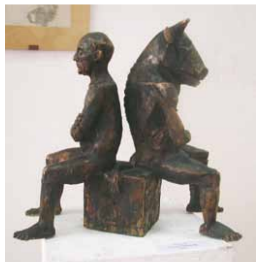
В. Тишин. "Пикассо - Минотавр". Бронза

Неожиданное объемно-пространственное решение предложила зрителю художница Е. Володина в остро современной композиции «Старец, отрок и свеча». Вероятно, самой сильной стороной московской скульптурной школы в новом тысячелетии по-прежнему остается фигуративная пластика. Это обстоятельство является лучшим подтверждением наличия в столице хорошей системы профессионального художественного образования. Однако, только