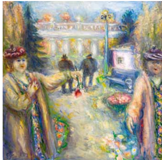
"Светская идиллия. Санаторий". 1980