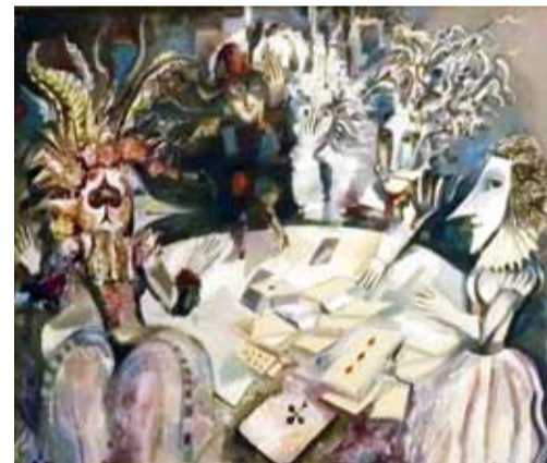
Е. Мацевский. "Карточный домик".