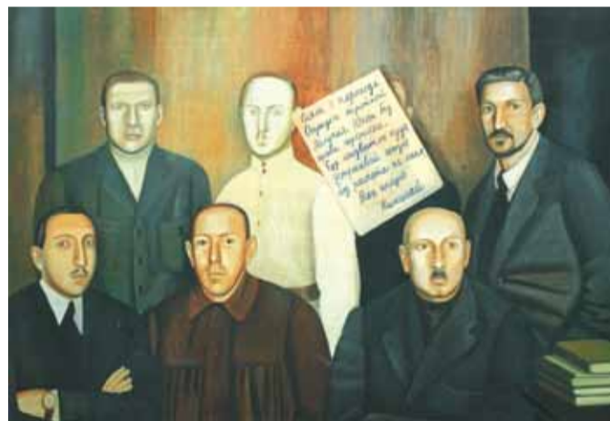
"Последнее письмо". 2010