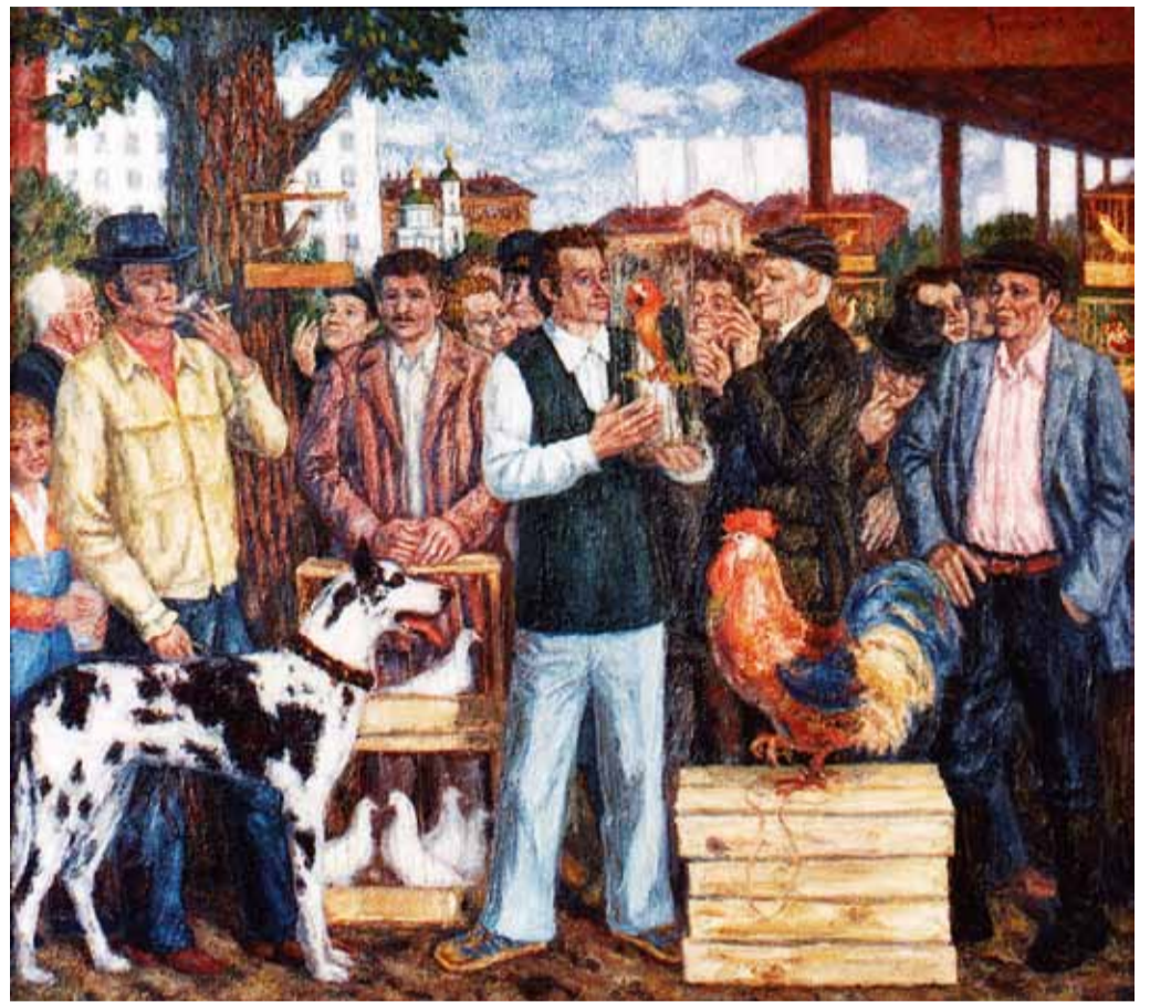
"На птичьем рынке". 1984