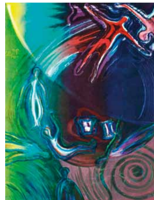
"Сируис. Встреча". Монотипия

Серия монотипий представляет особый интерес, поскольку каждый лист явился результатом многих прогонов. Как и в цветной гравюре, каждый цвет печатался (был оттиснут) отдельно. Эффекты просвечивания цветных плоскостей, непредна-