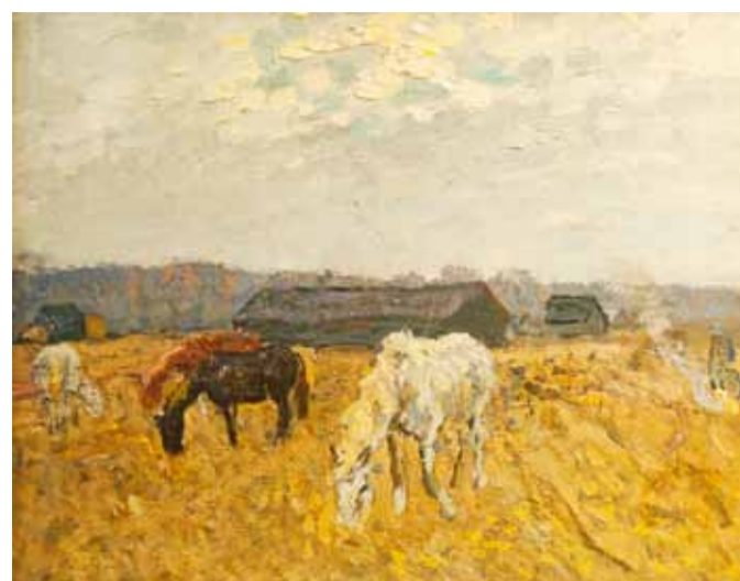
А. Ткачев. "Осень в деревне". 1975

Может быть, в наше время искусство братьев Ткачевых и кажется не слишком актуальным и несколько тяжеловесным. Но это — честное искусство, это правда без прикрас, в основном через