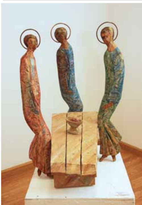
И. Балашов. "Троица". Дерево

Камерная по сути выставка скульптурной секции МСХ «Любимые скульптуры», к сожалению, кратко экспонированная в уютном пространстве залов на Кузнецком мосту, д. 20 в марте с.г., убедительно подтвердила качественный уровень московской школы ваяния, ее ведущие позиции в современном