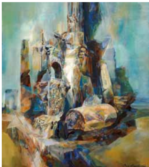
Д. Мацевский. "Материя разрушается - истина остается". 2007

С 2 по 16 марта с.г. в выставочном зале галереи искусств «Винсент», что в Кривоколенном переулке, с большим успехом прошла выставка двух известных московских художников Евгения и Дениса Мацевских. Деятельность галереи направлена на возрождение культурных ценностей, популяризацию русского искусства,