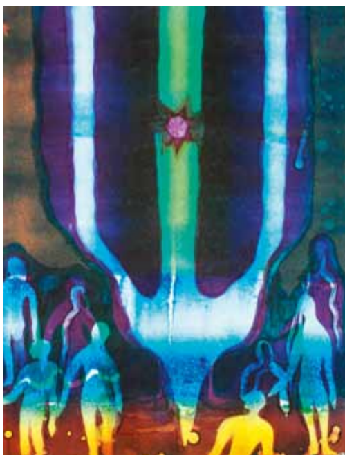
"Опространствление времени - Блаженство".

И было всё — вверху, как и внизу — Исполнено высоких соответствий. М. Волошин «Космос»