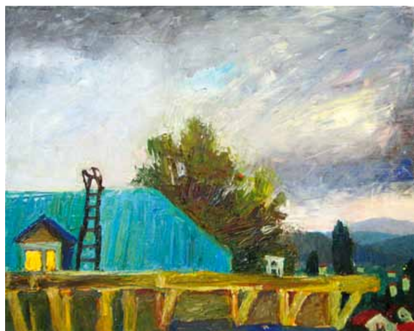
"После грозы на крыше".