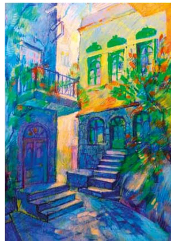
В. Конарев. "Турецкий дворик". Б., темпера. 2009