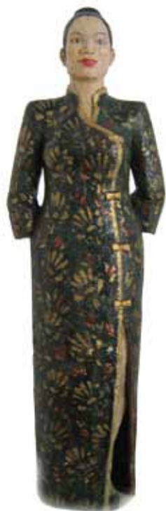
"Китайка". Шамот. 2007