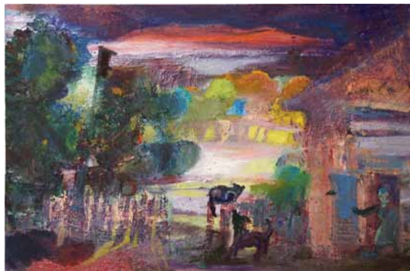
О. Платова. «В сумерках». Х., м.

Теме вернисажа, встречи и застолья художников посвящена также серия работ «Взгляд»