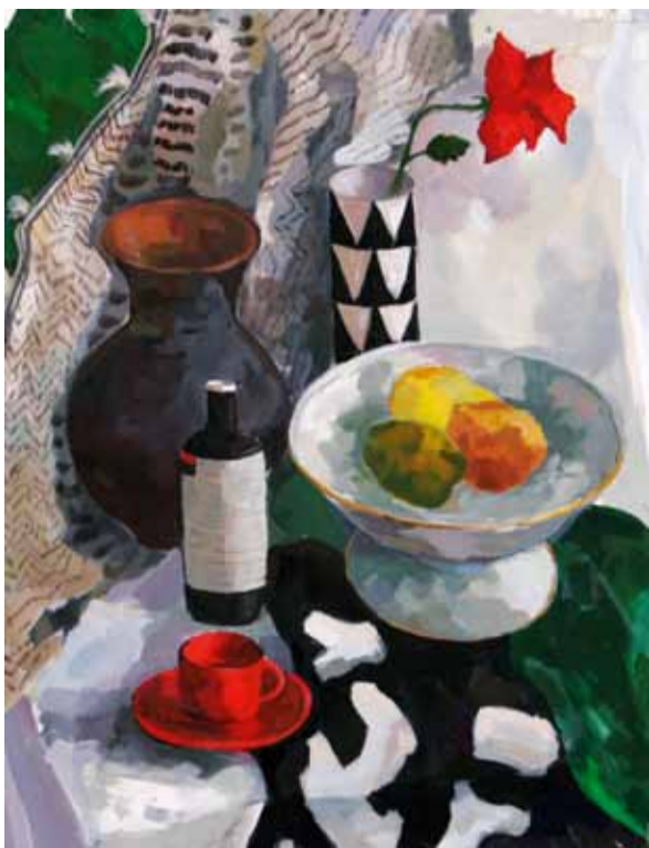
А. Мусина. "Натюрморт с розой". Темпера. 2011