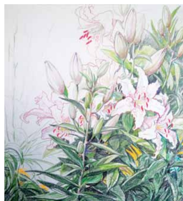
М. Вереина. "Белые лилии". Б., цв. кар. 2010