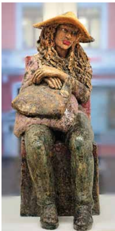
Г. Грозина. "В нью-йоркском метро". Шамот. 2007

У каждого человека свое путешествие. Кто-то испытывает радость узнавания архитектурных шедевров или постоянное дежа вю из учебника всемирной истории искусств, кто-то наблюдает местные типы и ищет дух повседневности, пытаясь хоть на короткое время посмотреть на объект путешествия изнутри. Одни места кажутся родными и зовут остаться здесь навсегда, другие – так и остаются непостижимым экзотическим местом.