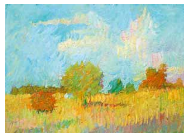
Ю. Махнев. "В полях под Тарусой". Х., м. 2011