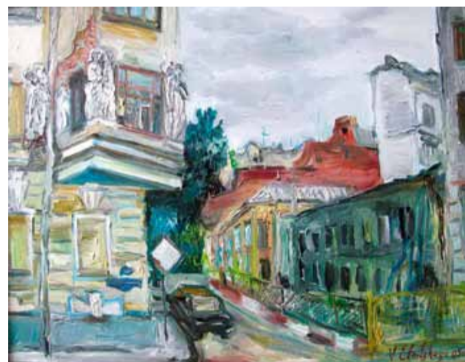
"Плотников переулок". 2009