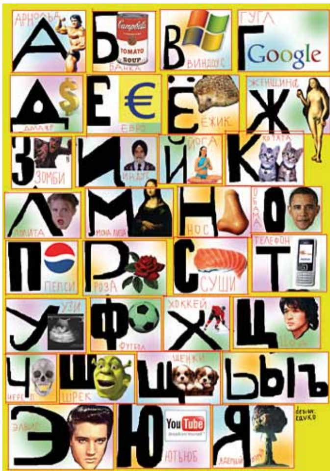
Д. Кавко. "Алфавит". Плакат. 2010

Нынешней осенью Московский Союз художников представил свою самую большую и яркую выставку, которую можно назвать итогом прошедшего года. «Пробный шар» был открыт в новом выставочном пространстве Москвы - Музейно-выставочном центре «Рабочий и колхозница» на ВДНХ.