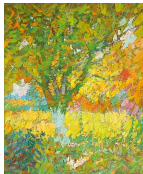
Ю. Махнев. "Под яблоней". К., м. 2011