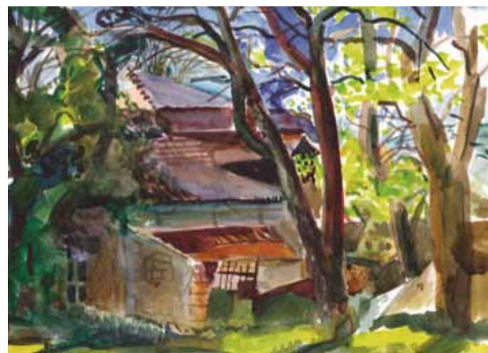
Р. Поляков. «В Саках». Б., акв. 2011