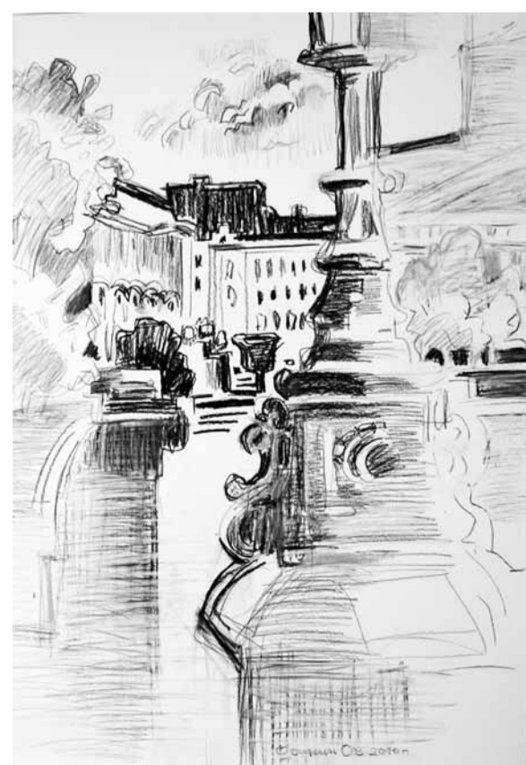
О. Осинин. "После дождя". Б., уг. кар. 2010