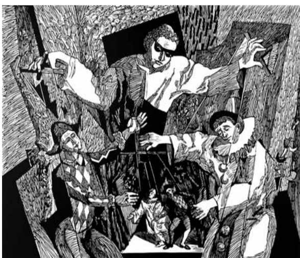
В. Филатов. "Все под контролем". Линогравюра. 2006