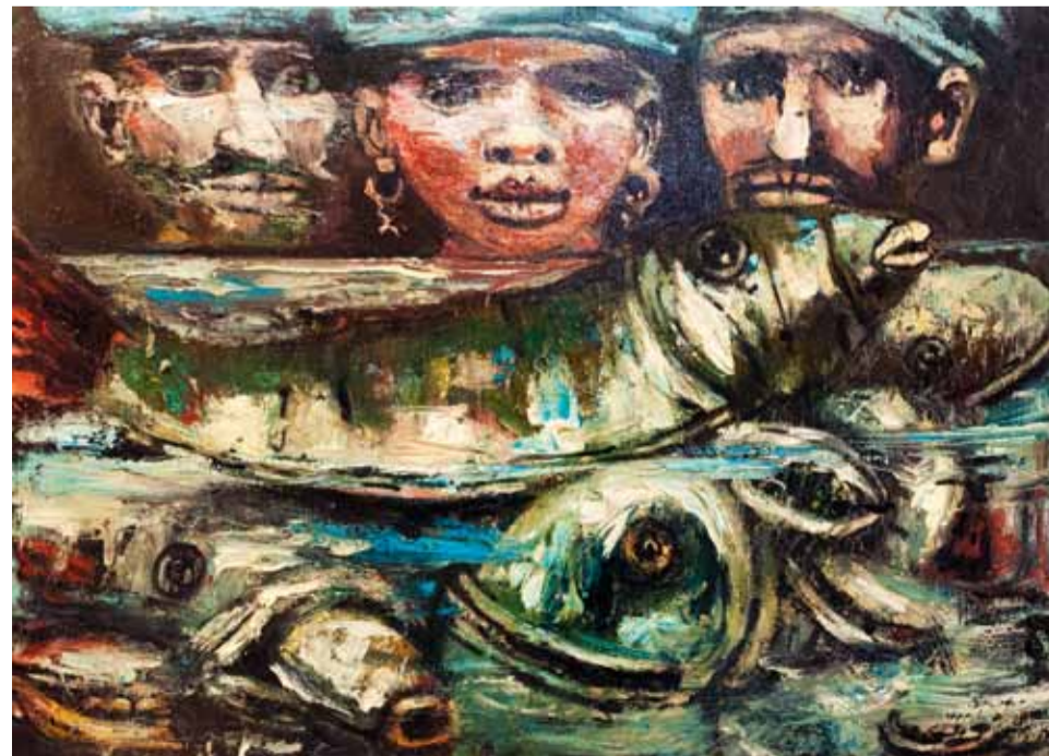
Л. Табенкин. "Аквариум". 2010