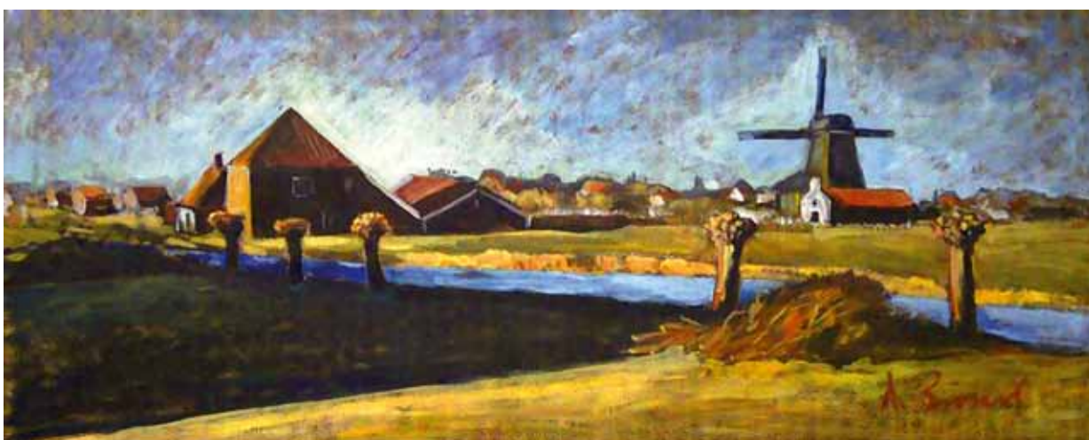
Л. Зюков. «Старая Голландия». Шелк, м. 2011