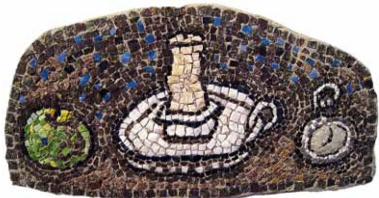
"Натюрморт со свечой".

Одно только искусство способно возродить духовные ценности в этом насковом прогнившем циничном мире.