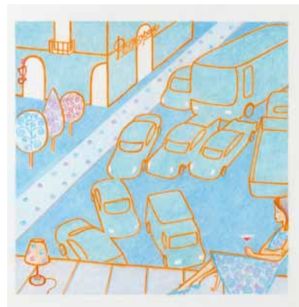
Б. Прохин. "Вечерний мартини". Б., пастель.