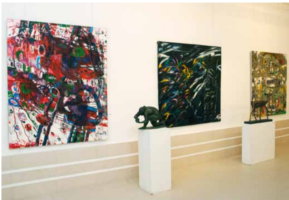
В залах выставки