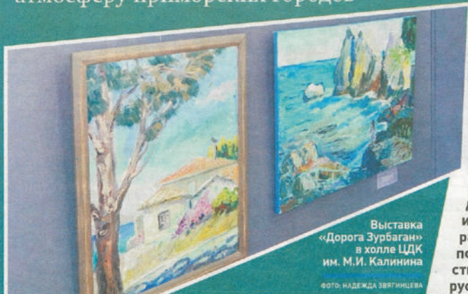
Выставка «Дорога Зурбаган» в холле ЦДК им. М.И. Калинина

Творчество 1 Команда художников-единомышленников приглашает королёвцев окунуться в феерическую атмосферу приморских городов