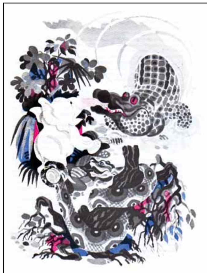
Илл. к сказкам Р. Киплинга.

Уже давно главное мое дело – преподавание в Московском университете печати, который сам окончил почти 55 лет назад. Недавно защищали дипломы студенты моего курса, который я вел 5 лет. Так получилось, что дипломы они практически делали без моего участия, их вели преподаватели кафедры книжного дизайна. Последнее время наши студенты в основном делают дипломы на компьютере, это почти всегда – оформительские работы, и я был уверен, что так будет и в этом году. Каково же было мое удивление, когда оказалось, что почти все работы представляли из себя обширные и серьезные