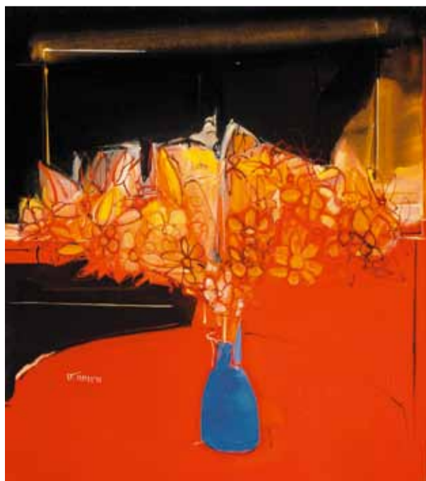
«Ночной натюрморт». 2000

Действительно, в творчестве мастера чувствуется глубокое знание живописной культуры. Суро свободно оперирует языком классических форм живописи, мыслит образами античной мифологии, в его масштабных фигуративных картинах слышатся отзвуки древнегреческих драм, творений Эсхила, Софокла и Еврипида. Мастер трактует вечные темы