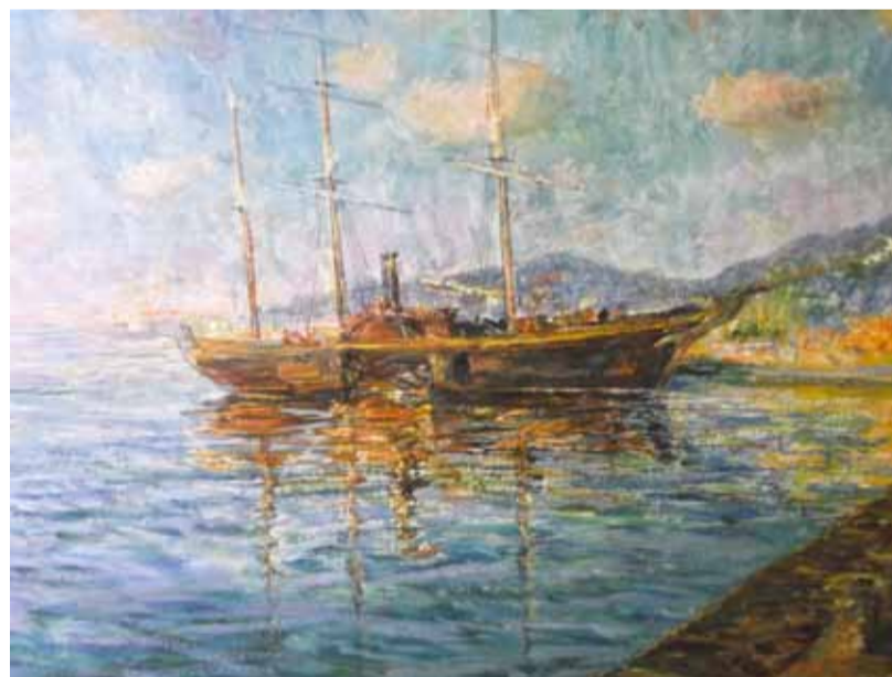
"Японский парусник у берегов Нагасаки". 2011

Эскиз к кинофильму «Амуланга» - одна из многочисленных кинематографических работ художника, представ-