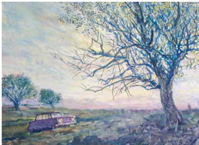
Эскиз к фильму "Амуланга". В стену. 1989