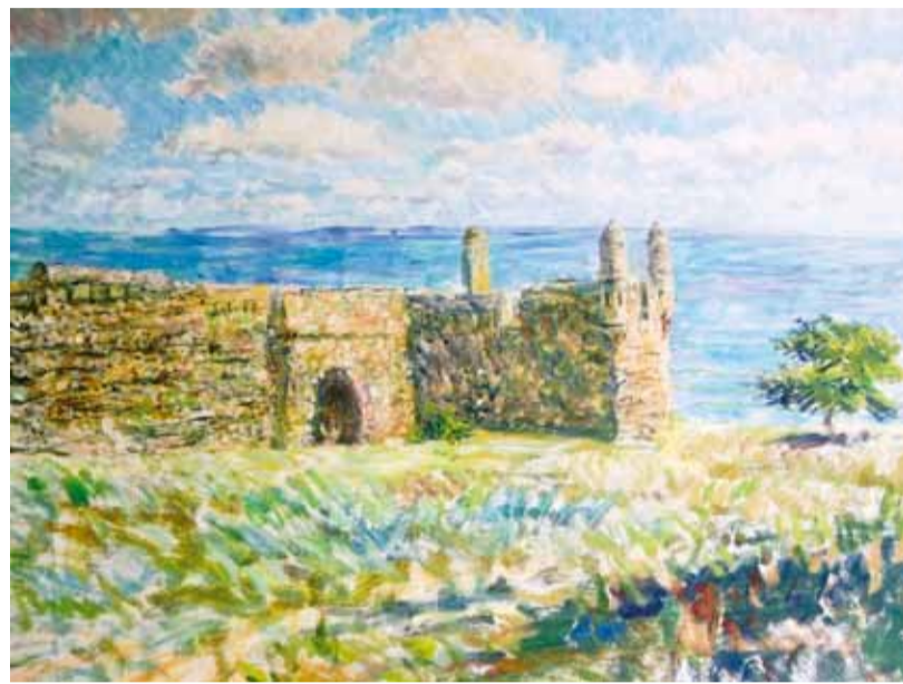
«Старая крепость Ени-Кале. Окрестности Керчи». 2012