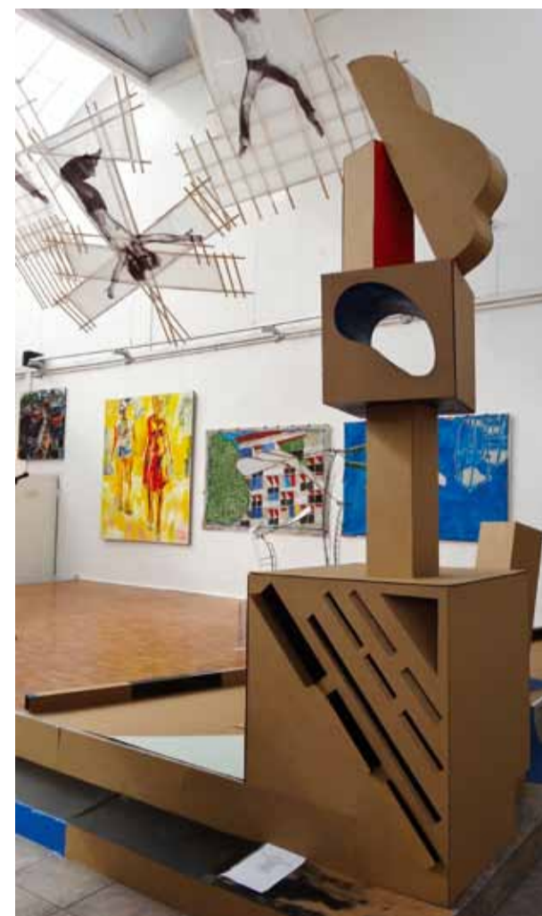
Инсталл. "Пространство для творчества". Творческое объединение им. Д. Менделеева. К., акр. 2013