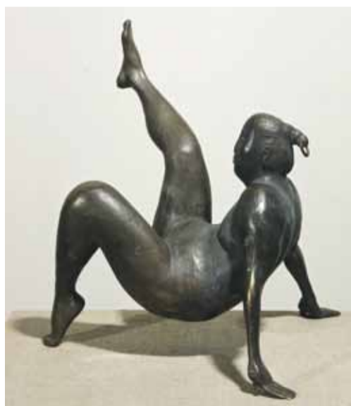
Д. Тугаринов. "Аэробика". Бронза

Основная идея выставки «Физкульт-привет!», которая открылась 18 июля с.г. в выставочном зале Государственного музейно-выставочного центра «РОСИЗО» (Люблинская ул., 48, стр. 1) – показать диалог между двумя разными эстетическими пластами в нашей культуре: спортивными фотографиями конца 1920-70-х гг. и современной скульптурой. Произведения художников представлены из собраний ГМВЦ «РОСИЗО», Российского государственного архива литературы и искусства и из частных собраний.