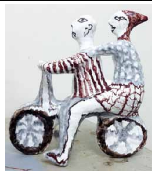
О. Хан. "Велосипедисты". Шамот.

Юмор и ирония являются характерными чертами скульптуры, представленной на выставке. Скульптура создает свой собственный мир, радикально отличный от того, который создает фотография. Мы видим часто те же самые сюжеты, но это уже образы, наполненные современным содержанием. Начиная с 80-х гг., в творчестве скульпторов все более заметно усиление индивидуальных тенденций,