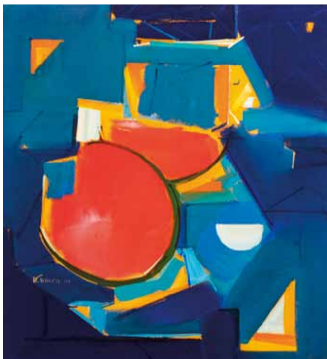
«Натюрморт с арбузом». 1998