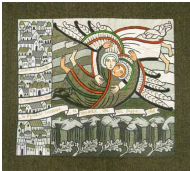
Н. Опарина. "Борьба Иакова с ангелом".

гофском фонтане «Самсон» шивает бисеринки, обозначивая таким образом игру бликов на воде. Тихо падающий снег – лоскутик ткани голубой в белый горошек – небо в работе «Вид из окна». В её работах даже жёсткий урбанизм приобретает лирический характер. Даже индустриальный пейзаж с дымящими трубами лиричен. Как же тут не сказать, что художник свою человеческую сущность выражает в своих работах.