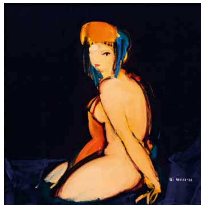
«Я Вас где-то видел». 2008

бытия. Любовь и страсть, грусть и печаль, надежда и вера, измена и верность, самопознание души – суть образов Суро лежит вне стилевых и временных границ. В его работах слышится дыхание вечности, они представляют полет души. Благодаря живописным качествам древние темы приобретают современное звучание.