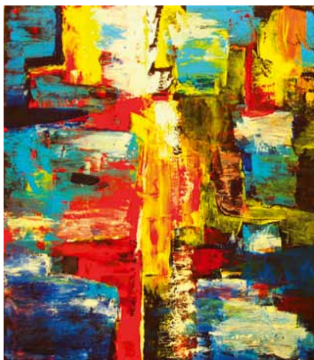
"Энергия. Красное. Синее".