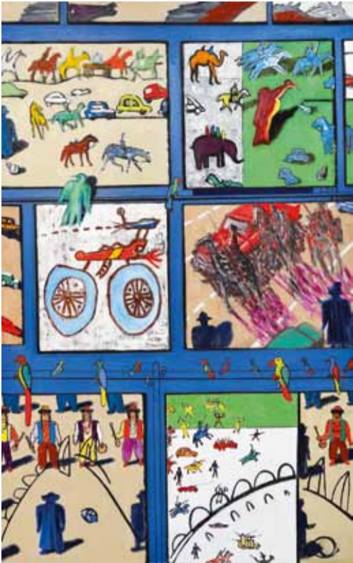
В. Бубнов. "Наша древняя столица". 2013