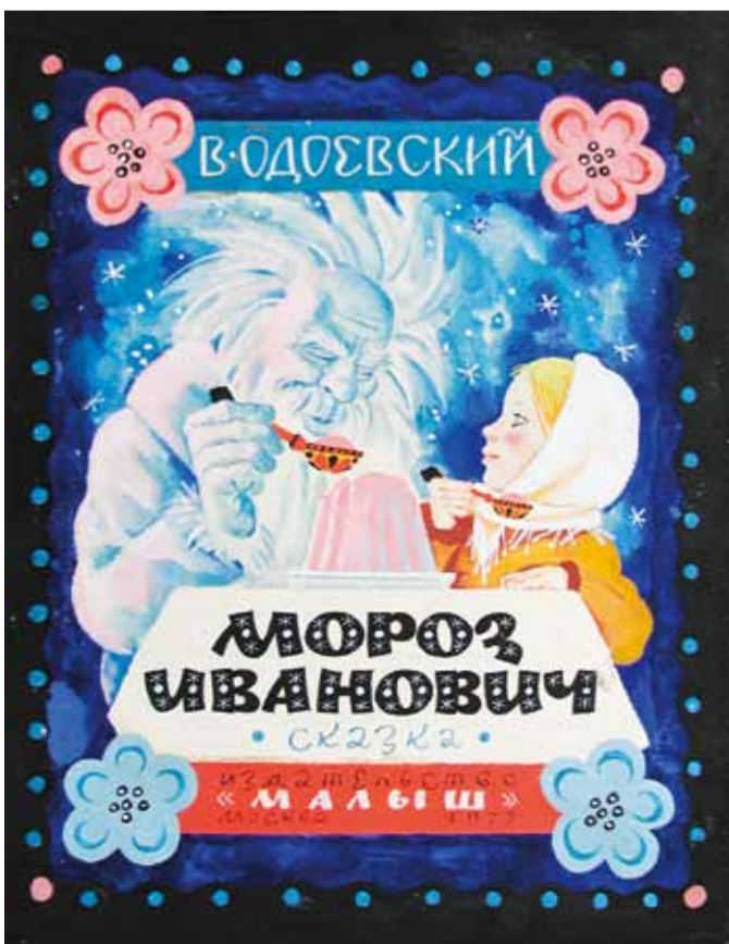
Илл. к сказке В. Одоевского "Мороз Иванович".