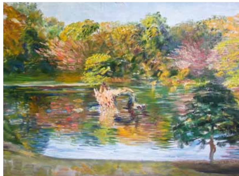
"В японском парке Рикугизэн". 2011