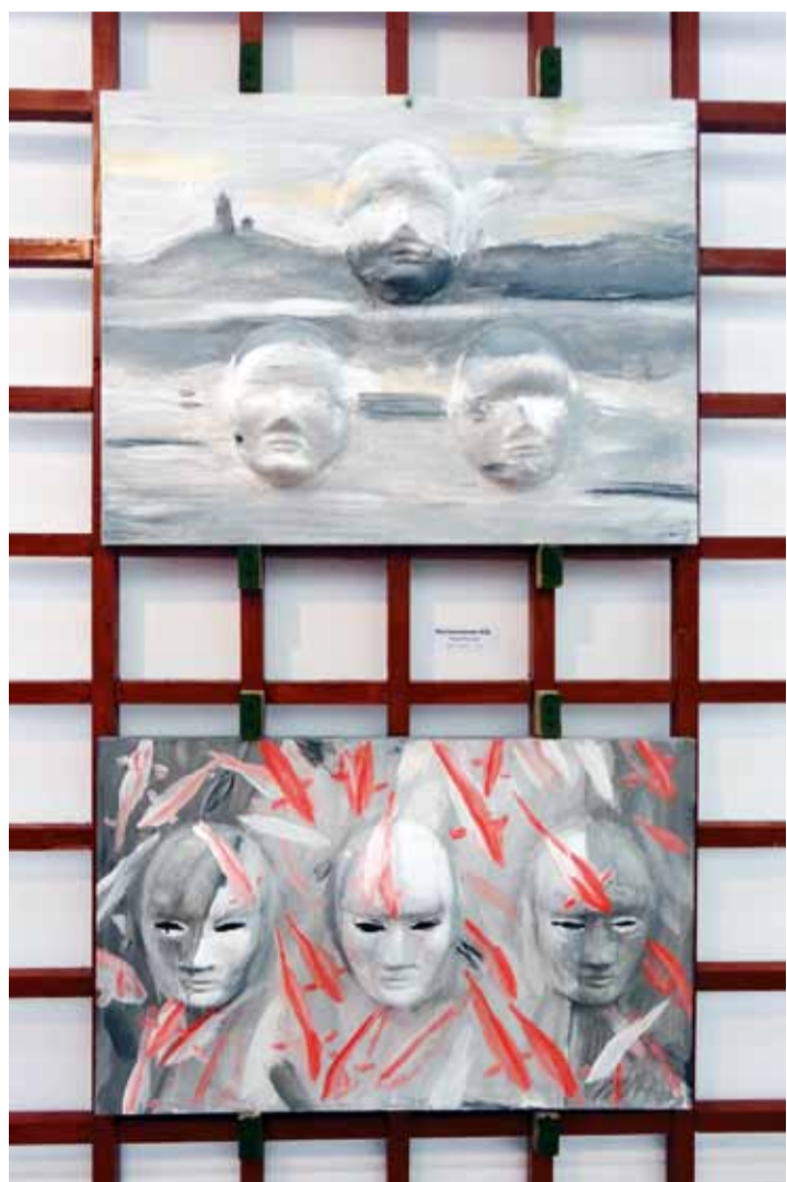
М. Красильникова. "Поднебесная". Смеш. техн. 2013