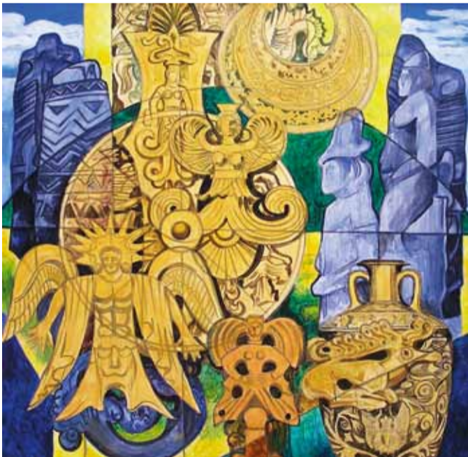
"Скифская культура до н.э". 2000

В июне с.г. в залах МСХ на Старосадском, 5 проходила выставка московского художника-монументалиста, почетного члена РАХ Виктора Пруса. Вот, как видит его творчество писатель, поэт, философ, директор музея космического искусства, профессор Юрий Линник.