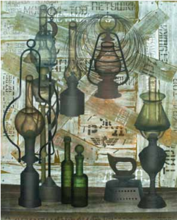
Б. Мессерер. "Натюрморт с керосиновыми лампами на фоне досок". Авт. техн. 2000