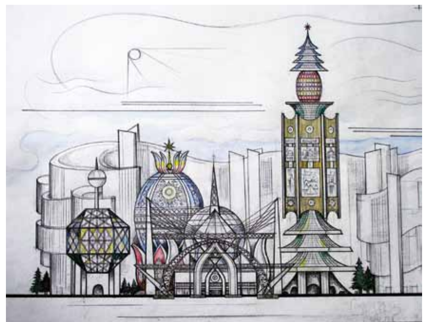
Проект реконструкции ЦДХ. 2010