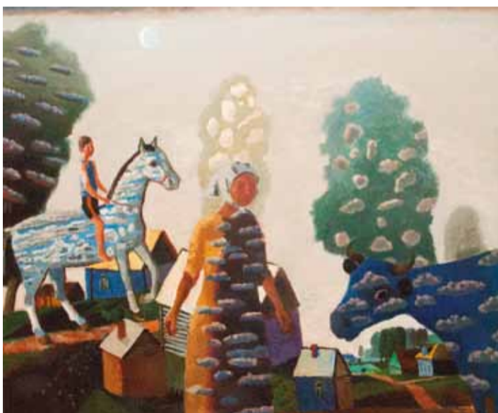
В. Кулаков. "Светлый день". 2012.