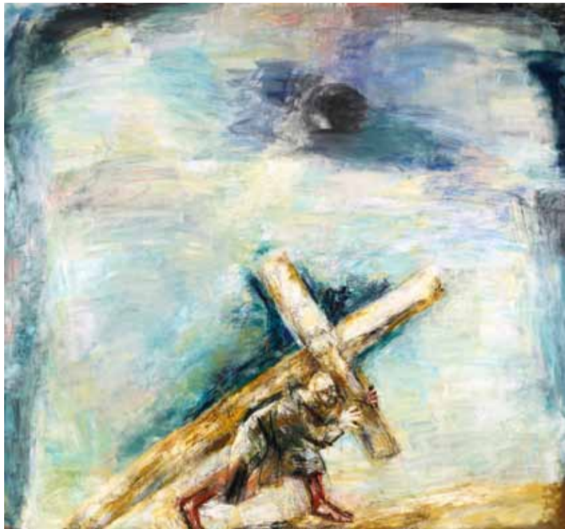
П. Никонов. "Несущий крест". 2012

ства во всей ее полноте. Не трудно было сказать – и, разумеется, говорилось, – что эта, в общем-то проходная, выставка не показала ничего сверхнового, что многих талантливых художников на ней не оказалось; что подавляющее число работ напоминали что-то давно известное и т.п. И все же Салон 2012 явился столь многообразным, что по нему, безусловно, можно судить о некоторых общих тенденциях в нашем изобразительном искусстве.