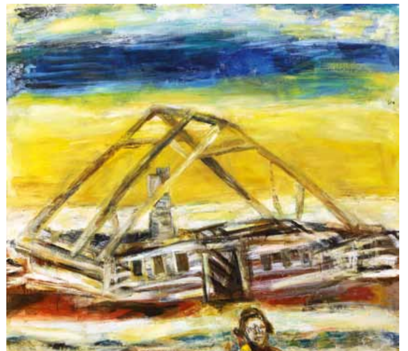
П. Никонов. "Зима". 2012

Итак, огромная выставка, множество имен, сотни вещей. Нельзя, разумеется, сбрасывать со счета, что при отборе работ жюри могло руководствоваться некими пристрастиями и соображениями; что срез искусства, представший в ЦДХ, не отражал картины современного изобразительного искус-