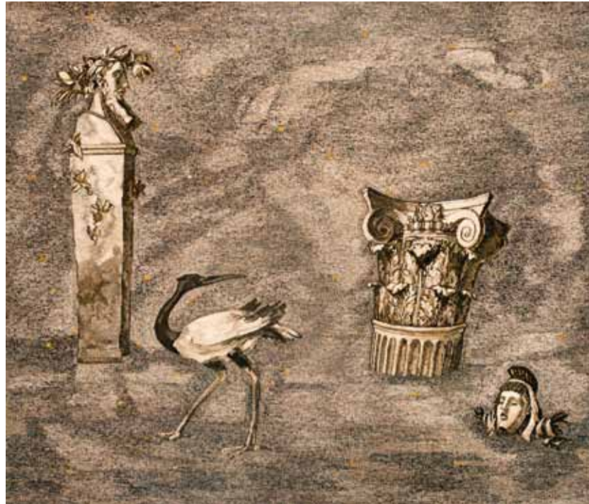
А. Шмакова. "Помпейский пепел". Гобелен. Шерсть, ручн. ткач. 2011