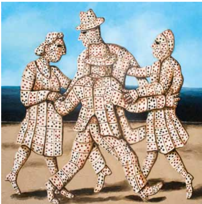
Н. Нестерова. "Хоровод на песке". 2008