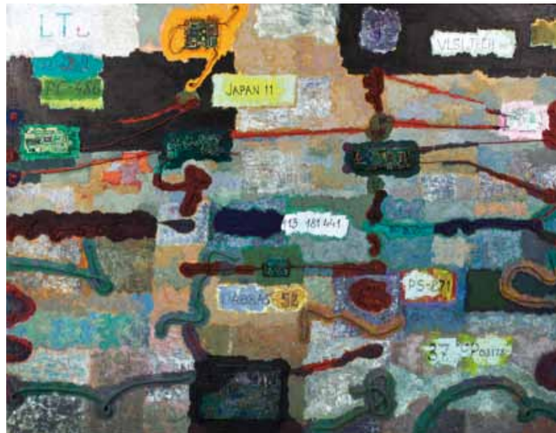
"486". Коллаж. 2011

Новый проект художника «E-crucifix» - размышление о жизни современного человека в век «электронной цивилизации» со всеми ее достижениями и катастрофами. В коллажных живописных работах и объектах последнего времени используются компьютерные платы, так или иначе мотивом его произведений являются компьютер, Интернет, техногенные катастрофы, в том числе трагедия 2011 года на японской атомной станции Фукусима. Об этом