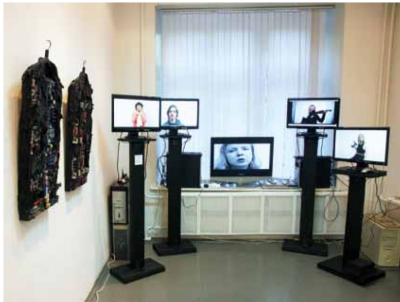
Инсталляция "Песня аватаров". 2012

В Московском выставочном зале «Галерея А-3» с 15 мая по 1 июня 2012 года был представлен проект московского художника Владимира Опара «E-crucifix».