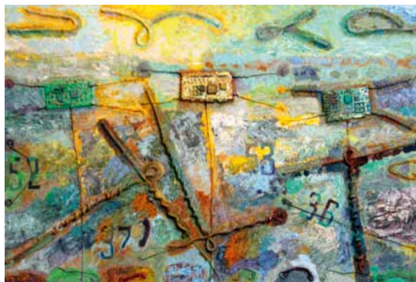
"Электронное Распятие". Коллаж. 2011

картины «Фейсбук: новая Ева», «486», «Атомная электростанция», «Сотворение мира». В его работах пересекаются Библейские мотивы и реальные истории людей, использующих компьютерные технологии.