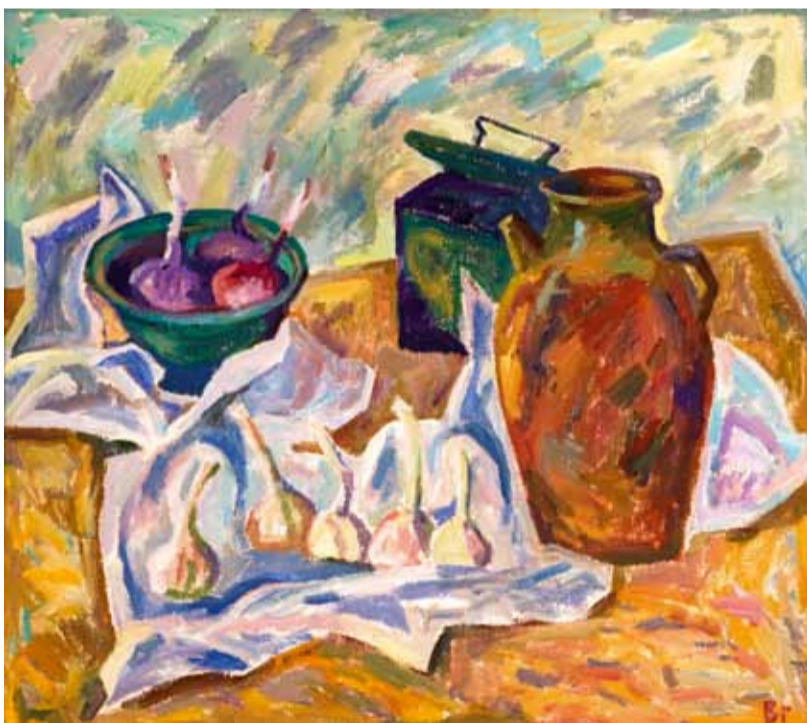
В. Глухов. "Натюрморт с чесноком". 2011

В апреле этого года в Российской академии художеств совместно с Музеем современного искусства прошла научная конференция «ИСКУССТВО И КРИЗИС. Кризис искусства как социального института». Приглашение на конференцию предваряла «концепция»: «Социокультурная ситуация, в которой общество находится в настоящий момент, определяется, с одной стороны, действием факторов, утративших свою релевантность сегодняшнему дню, и обращением к устаревшим логикам, с другой, присутствием сил, которые пока не оформились в определенные движения и не получили определения. Очевидно, что многие стратегии исчерпали себя и перестали быть