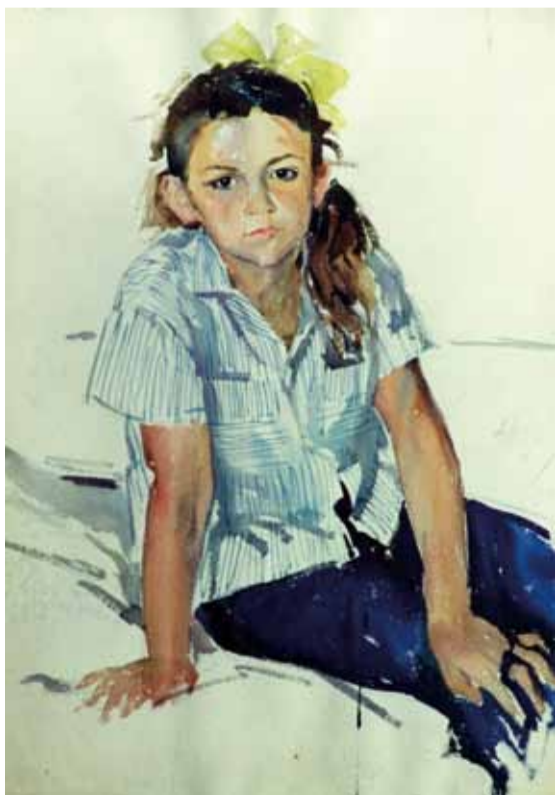
"Галочка". Б., акв. 1968

С творчеством Юрия Ивановича Масютина (1928-2012) впервые я познакомился в «Мастерской уникальной графики» в конце 1970-х годов. Меня поразила легкость и точность его рисунков — рисунков карандашом и кистью. Любой материал в руках этого мастера превращал натуру — портрет, натюрморт, пейзаж — в произведение искусства. И хотя Юрий был ограничен в своих возможностях коммуникации с окружающим его миром людей, в своих картинах и рисунках он прекрасно чувствовал и передавал гармонию, музыку и многоцветье нашего огромного мира.