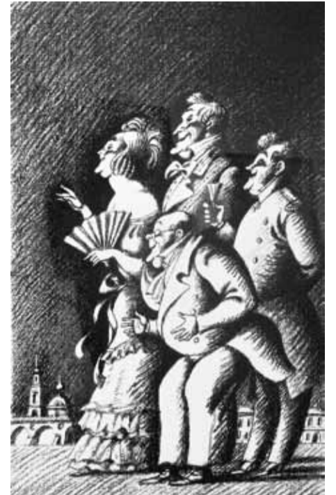
С. Алимов. Серия иллюстраций к "Мёртвым душам" Н. Гоголя. Шелкография. 2012

ставленных в экспозиции произведений, выполненных в различных материалах и техниках, по-разному выявляет взаимосвязи социальной и духовной сфер, ведет к осознанию творцом своего «я». Такой подход дает возможность проследить тонкие сопряжения, возникающие в переплетении сюжетных ходов. Емкий символический образ наполняет работы М. Аввакумова, И. Старженецкой, В. Башенина, И. Калининой, а абстрактные полотна И. Глуховой полны колористической гармонии. Запоминающиеся образы А. Ситникова (серия «Родная речь») и О. Булгако-