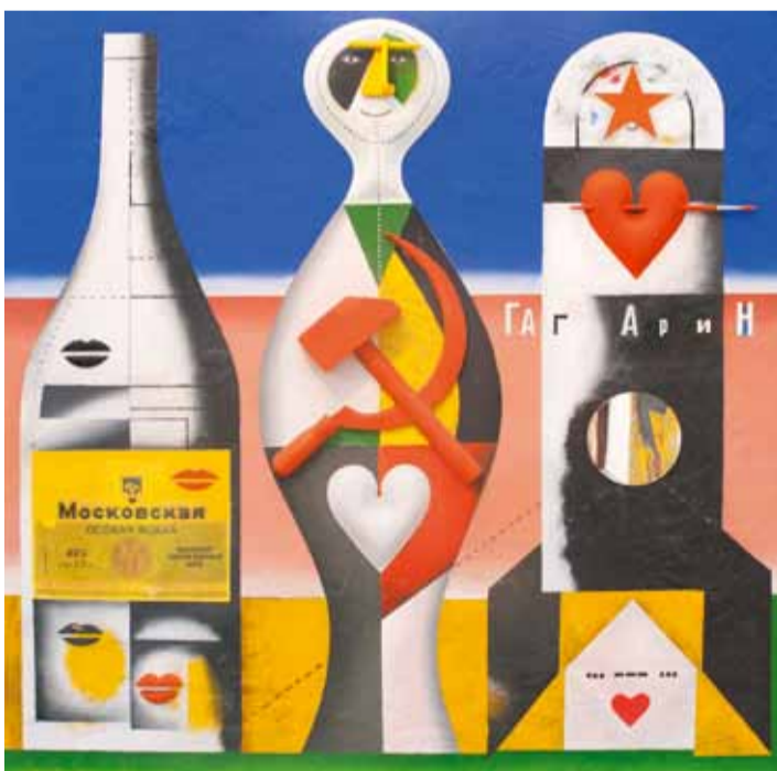
А. Ситников. Серия "Родная речь". "Стаффаж". Смеш. тех. 2012

С 9 по 20 июня с.г. в залах Дома художника на Кузнецком мосту, 11 состоялась межсекционная выставка с интригующим названием «Метафизика. Выставка произведений московских художников». Она продолжает ряд юбилейных экспозиций этого года, приуроченных к 80-летию Московского Союза художников.