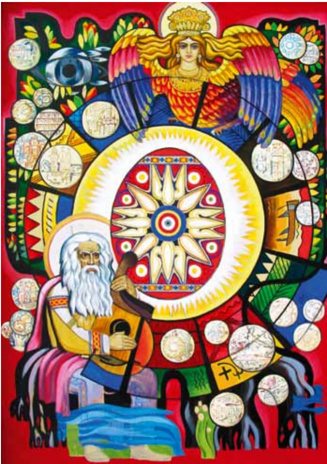
"Культура народов Центральной Евразии за XX тысячелетий". 2000