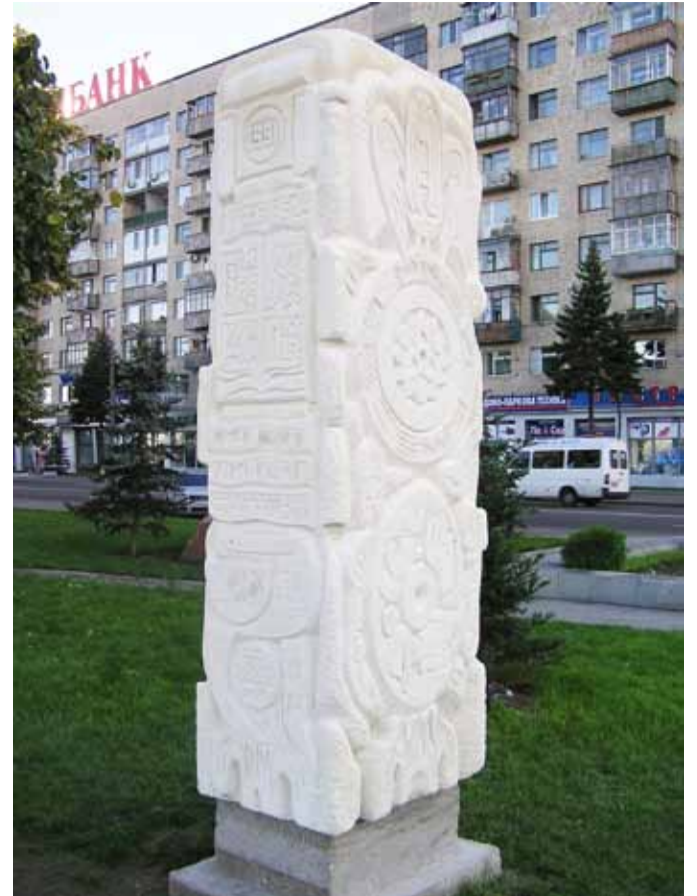
"Культура моей Родины за XX тысячелетий". Крымский камень. 2006

Таков архетип Мирового Яйца. Вот мы видим: Мировое Яйцо обретает колос-