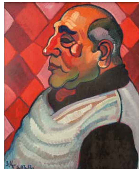
З. Церетели. "Портрет Важи". 2012